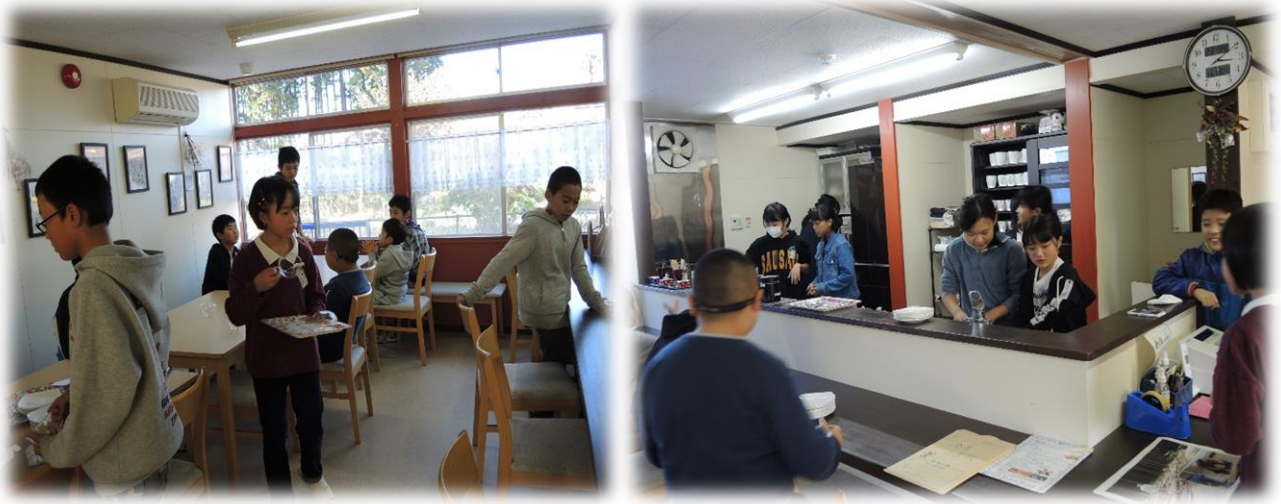
◇金屋小学校6年生：カフェでの様子◇