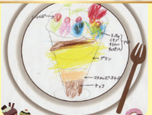
プリンチョコパフェアイス