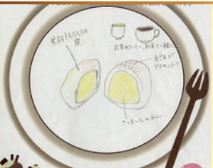
シルクスイートまんじゅう

お菓子屋さん nico 営業時間 10:00~19:00 (毎週月曜日はお休み) 村上市山口331-25 ☎0254-62-7300