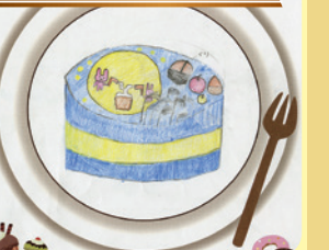
みんなで秋を感じYo!