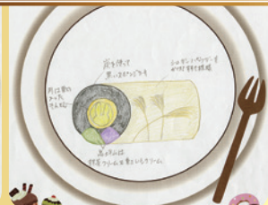
高坪山からひよこり満月ロールケーキ

協賛 (有)夢ファームあらかわ 岩船米・もち・赤飯・いちご狩り (2月下旬~5月下旬)