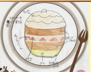
秋のどんぐりケーキ

御菓子の小島屋 営業時間 10:00~19:30 (不定休) 村上市藤沢91-5 ☎0254-62-2152